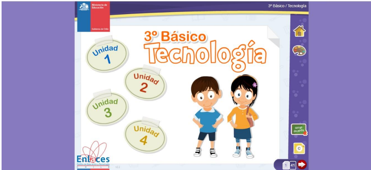
Imagen guía para el material didáctico de tecnología