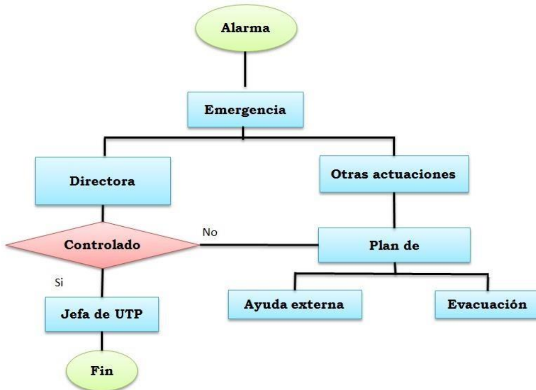
Diagrama X.2: Esquema de secuencia al sonido de la alarma.